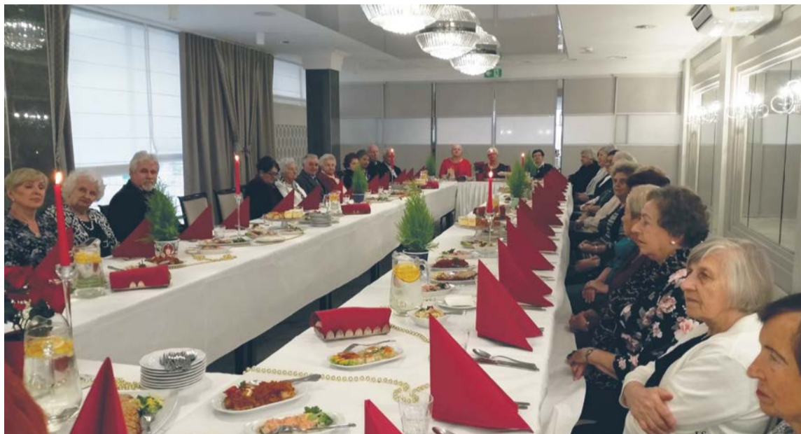
Spotkanie opłatkowe przed pandemią to tradycja Oddziałowej Sekcji Emerytów i Rencistów z Łomży

Związek Nauczycielstwa Polskiego to, to co łączy nauczycielską brać. To przewodnik szkoły polskiej. To ludzie oddani swojej pracy dla dobra dzieci i młodzieży. Choć ma 110 lat, to ciągle trwa, łączy nauczycieli czynnych i emerytów.