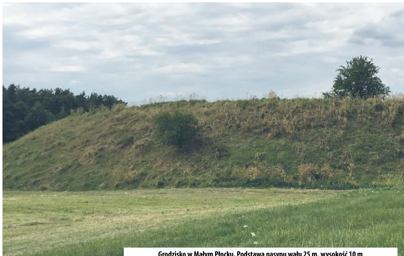
Grodzisko w Małym Płocku. Podstawa nasypu wału 25 m, wysokość 10 m